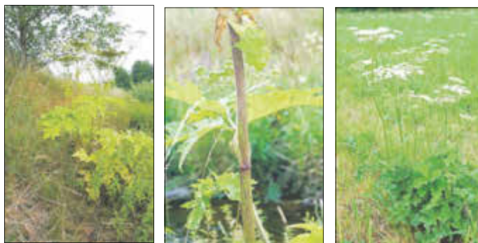
Riesenbärenklau (links), deutlich gemusterter Stängel (Mitte) und Wiesenbärenklau (rechts) beides in der Würschnitzaue.

Also, wenn wir das Futter in Wiesenflächen suchen, werden wir in aller Regel den Wiesenbärenklau finden, der bei den