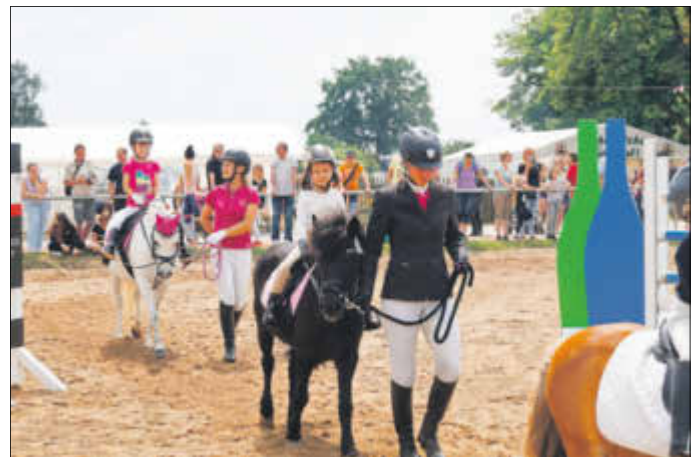
Wettbewerb der Führzügelklasse in Seifersdorf 2018

Am 03.10. werden Dressurprüfungen von der Klasse E bis zur mittelschweren Klasse auf dem Dressurplatz durchgeführt. Am 05. und 06.10. stehen Springprüfungen der Klassen E bis M** auf dem Programm. In fast allen Prüfungen ist der Verein mit eigenen Reitern gut vertreten. Außerdem werden wieder viele Gäste aus Sachsen und den benachbarten Bundesländern erwartet. Auch die jüngsten sind in der Führzügelklasse mit am Start.