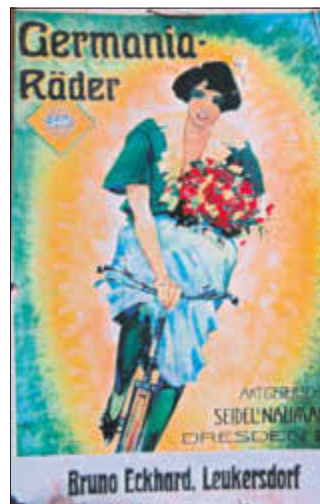
Werbeplakat Firma Eckhard Leukersdorf