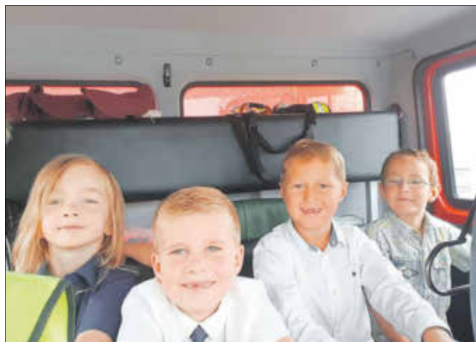
Die Fahrt mit den Feuerwehrautos unserer Gemeinde ist für die Schulanfänger immer ein besonderes Highlight.

Zweckverband Abfallwirtschaft Südwestsachsen