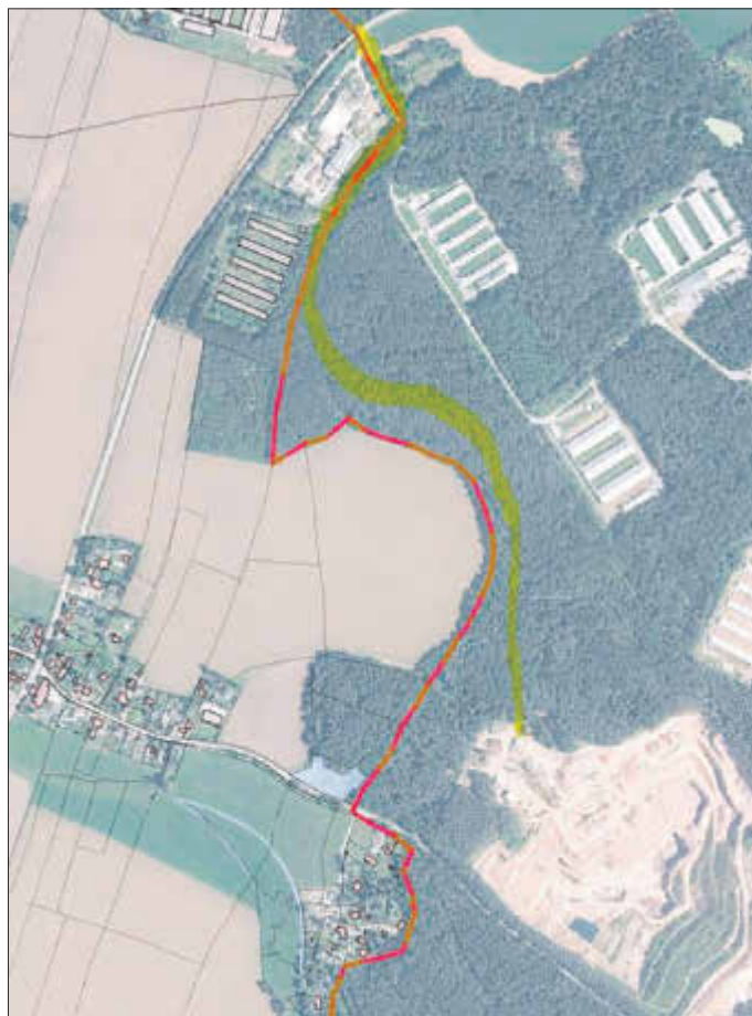
(rot: Gemarkungsgrenze; gelb: geplante Route)

Nur leider sah ein zu beteiligter Grundstückseigentümer nur seine Interessen und war nicht bereit, diese unter entsprechendem Ausgleich zu Gunsten der Allgemeinheit etwas zurückzufahren. So fand nach anfänglichen Gesprächen schlussendlich nur noch Schriftwechsel mit der Firma Eifrisch statt. Daher mussten die Bemühungen aufgrund dieser Weigerung eingestellt werden. Eigentum steht unter hohem Schutz – so kann ich als Bürgermeister der Gemeinde Jahnsdorf, so gut ich diese Idee auch finde, diese aktuell nicht umsetzen.