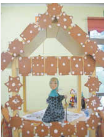
Die Kinder und das Erzieher-team der Kita „Sonnenschein“

Die Kinder brauchen und lieben Märchen, denn Märchen unterstützen die Kinder in ihren Fragen. Das gute Ende der Märchen wirkt Mut machend und stärkt das Selbstbewusstsein der Kinder. Aber lösen Märchen nicht auch Ängste bei den Kindern aus? Das Gefühl von Angst ist absolut natürlich und dieses Gefühl zu überwinden, ist eine wichtige Erfahrung für Kinder. In den Märchen wird das Böse besiegt und die Kinder in ihrer Angstbewältigung gestärkt. Durch das Vorlesen der Märchen werden die Kinder auf der emotionalen Ebene angesprochen. Sie werden mit den verschiedenen Gefühlswelten vertraut gemacht und können sich in diesem Bereich weiterentwickeln.